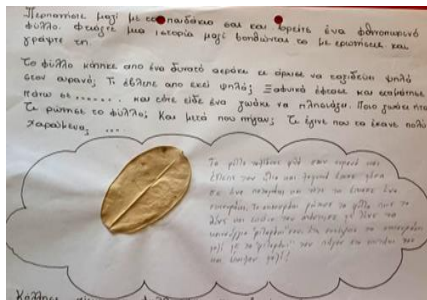
Εικόνα 5. Παραμυθιά από τα παιδιά με βοήθεια ερωτήσεων