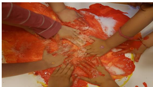
Εικόνα 9. Πειραματισμός με υλικά και υφές