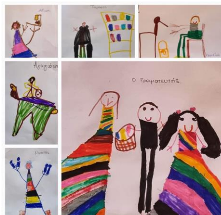
Εικόνα 22. Τα παιδιά ζωγραφίζουν τα επαγγέλματα