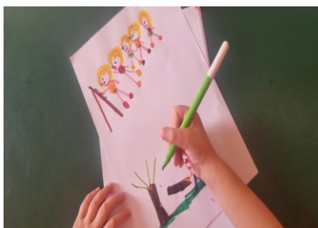
Εικόνα 26. Τα παιδιά ζωγραφίζουν τη ζωή των ζωγράφων