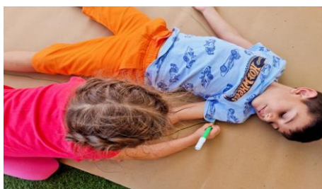
Εικόνα 11. Το σώμα μου