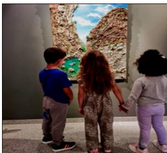
Εικόνα 4. Επίσκεψη στο μουσείο Τυλισού