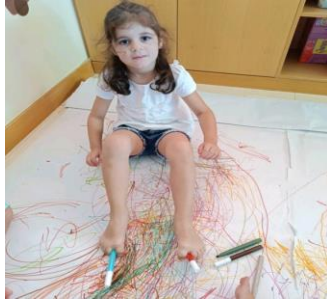
Εικόνα 15. Ζωγραφίζω με τα πόδια