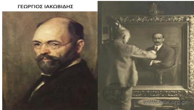
Εικόνα 6. Γνωρίζουμε τη ζωή και το έργο των ζωγράφων