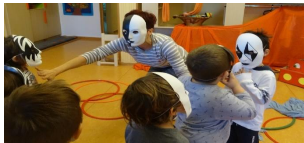
Εικόνα 18. Ηχοϊστορία με ερέθισμα πινάκων ζωγραφικής