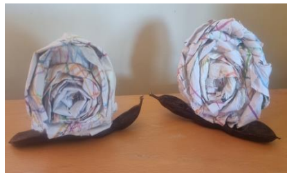
Εικόνα 17. Πειραματισμός με τεχνικές, ολοκληρώνεται η κατασκευή