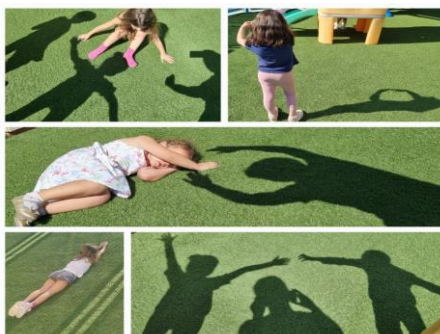
Εικόνα 10. Πειραματισμός με φως και σκιά σε ταμπλό βιβάν