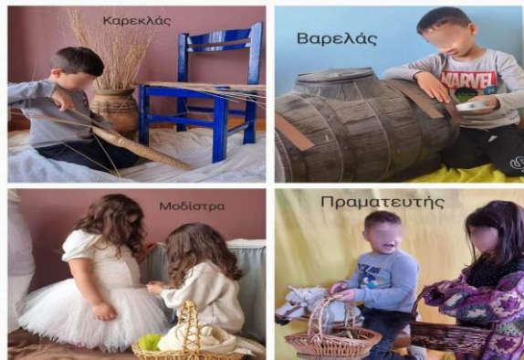
Εικόνα 21. Τα επαγγέλματα... Ζωντανεύουν