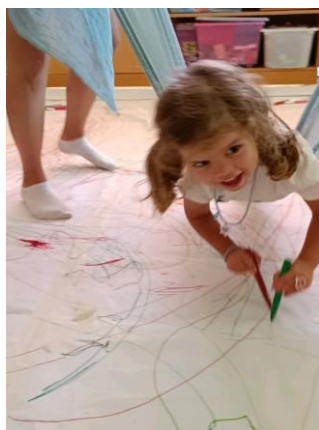
Εικόνα 13. Ζωγραφίζω με αιώρηση