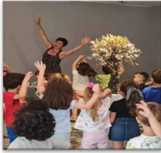
Εικόνα 5. Μνημειακή αφορμή για θεατρικό παιχνίδι