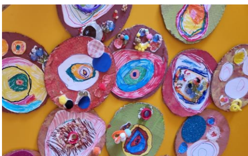
Εικόνα 8. Έργα τέχνης με αφορμή τους κύκλους του Καντίνσκι