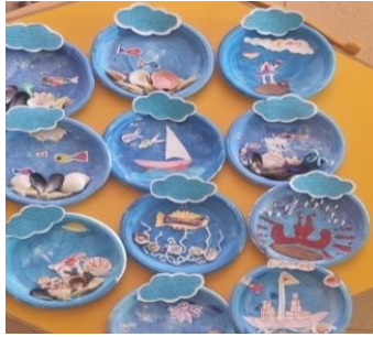
Εικόνα 16. Εικαστικά έργα με ερέθισμα έναν πίνακα