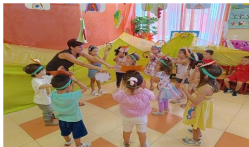
Εικόνα 19. Ηχοϊστορίες