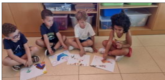
Εικόνα 3. Δημιουργία παραμυθιού από ζωγραφιές των παιδιών