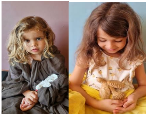
Εικόνα 23 & 24. Τα παιδιά σκηνοθετούν τη φωτογραφία τους