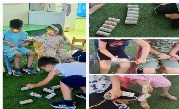
Εικόνα 7. Παιχνίδια Αρίθμησης