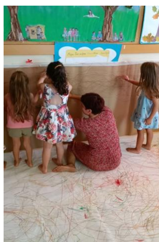
Εικόνα 14. Ζωγραφίζω με μουσική με τα χέρια και το στόμα