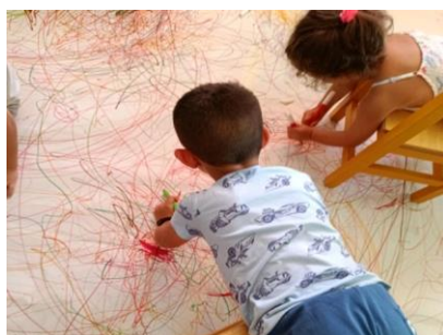
Εικόνα 12. Ζωγραφίζω το σώμα μου σε μεγάλη επιφάνεια με διάφορους τρόπους στάσης του