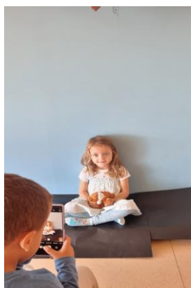
Εικόνα 25. Παιδιά φωτογράφοι