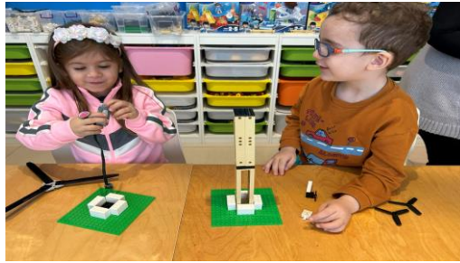
Εικόνα 20. Ρομποτική και Ψηφιακή Τέχνη